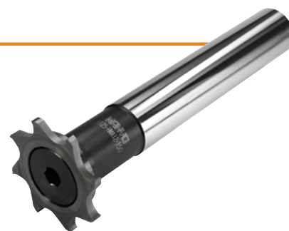
(MODULAR SLOT CUTTER-SH)