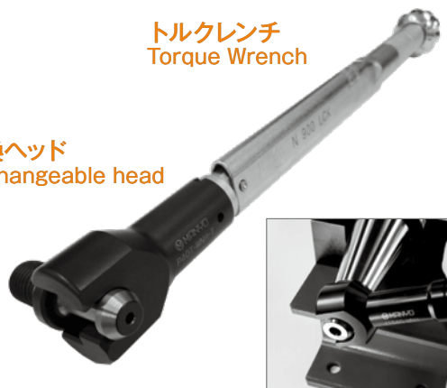
交換ヘッド Exchangeable head