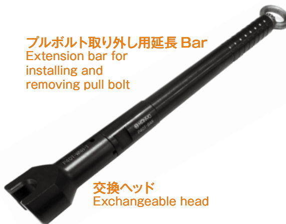
交換ヘッド Exchangeable head